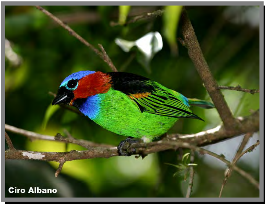
Tangara cyanocephala cearensis Guaramiranga, CE, 13/XI/2006

O BOLETIM INFORMATIVO DA SOCIEDADE BRASILEIRA DE ORNITOLOGIA, COM PERIODICIDADE IRREGULAR, DESTINA-SE À DIVULGAÇÃO DE ASSUNTOS DIVERSOS DA ENTIDADE, CONGRESSO BRASILEIRO DE ORNITOLOGIA E OUTROS ACONTECIMENTOS DA ORNITOLOGIA BRASILEIRA. CONTRIBUIÇÕES DEVEM SER ENCAMINHADAS AO E-MAIL secretaria@ararajuba.org.br