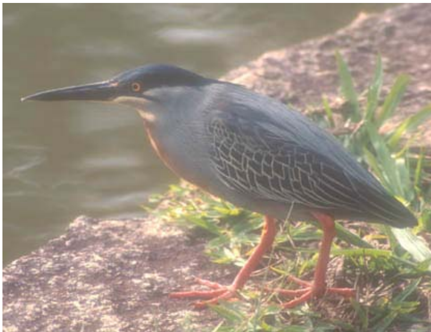
Socózinho, Butorides striatus Parque Edmundo Zanoni, Atibaia, SP

O Boletim Informativo da Sociedade Brasileira de Ornitologia, com periodicidade irregular, destina-se à divulgação de assuntos diversos da entidade, Congresso Brasileiro de Ornitologia e outros acontecimentos da ornitologia brasileira. Contribuições devem ser encaminhadas ao Editor, Luiz Fernando Figueiredo luizfigueiredo@uol.com.br