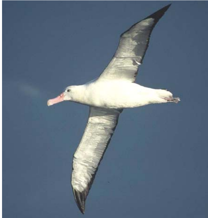
Albatroz-gigante, Diomedea exulans (28 57'S, 44 19'W)